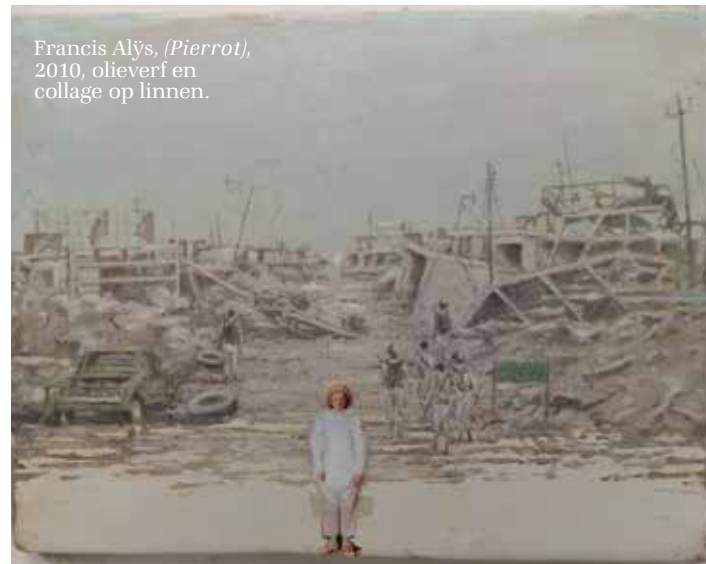
Francis Alÿs, (Pierrot) , 2010, olieverf en collage op linnen.

En dan thema's als oorlog, onderdrukking en vluchtelingen. Op de tentoonstelling Het Afwezige Museum in Wiels (Brussel) hing een fraai schilderijtje van de uit Antwerpen afkomstige Francis Alÿs. Daarin plaatste hij een comedia dell'arte pierrot uit een achttiende-eeuws schilderij van Watteau tegen de achtergrond van een door hem zelf geschilderd slagveld in Mosul. Een stad waar hij zelf lange tijd verbleef