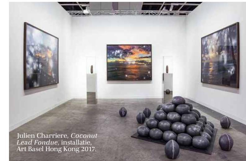
Julien Charrière, Coconut Lead Fondue , installatie, Art Basel Hong Kong 2017.

2018 presenteert hij het resultaat daarvan in het paviljoen Prospects & Concepts. Voor de film Ex Topia , die hij samen met Eva Pavlic Seifert over de expeditie maakte, filmde hij het kale landschap en interviewde hij enkele deelnemers. Hen werd gevraagd te reageren op de veranderingen in bodemgesteldheid en landschap, ontstaan door opwarming van de aarde en klimaatverandering. De Finse kunstenaar Osmo Rauhala gooit het over een ander boeg. Hij waarschuwt al jaren voor de gevaren van genetische manipulatie van ons voedsel: insecten zullen verdwijnen en de ontstane monocultuur zal uiteindelijk leiden tot een aanzienlijk verlies van de natuur en de voedselkwaliteit. We kunnen volgens Rauhala nog niet alle gevolgen van genmanipulatie overzien. Waarom passen we die techniek dan nu wel toe?