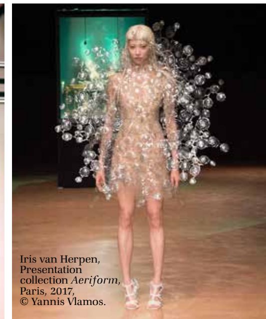
Iris van Herpen, Presentation collection Aeriform , Paris, 2017, © Yannis Vlamos.

tekeningen op dezelfde hoogte vlak naast elkaar. Het geheel gaf een merkwaardig afstandelijk beeld: de robot bleek de pijnlijke handelingen geanonimiseerd te hebben. Ook de Rotterdamse kunstenaar-filosoof Marcel Wesdorp gebruikt de computer voor zijn kunstuitingen. Zijn eerste fotografische landschap baseerde hij op de data die de NASA hem aanleverde in de vorm van DEM (Digital Elevation Model) files, waarmee de hele aardkorst digitaal in kaart was gebracht. Met die gegevens kon Wesdorp een landschap samenstellen op de computer met behulp van een 3D computerprogramma en fractal rendering . In de jaren erna wist hij een tweede aaneensluitend landschap op de computer te maken met een formaat van 320 miljoen pixels. De film die daaruit ontstond met de titel I Wish I Couldn't Lie , bracht een schitterende, meer dan vier uur durende vlucht boven een virtueel landschap met kraters, kliffen en bergen in beeld.