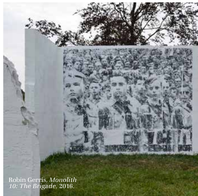
Robin Gerris, Monolith 10: The Brigade , 2016.