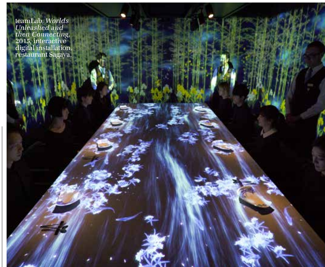
teamLab, Worlds Unleashed and then Connecting , 2015, interactive digital installation, restaurant Sagaya.