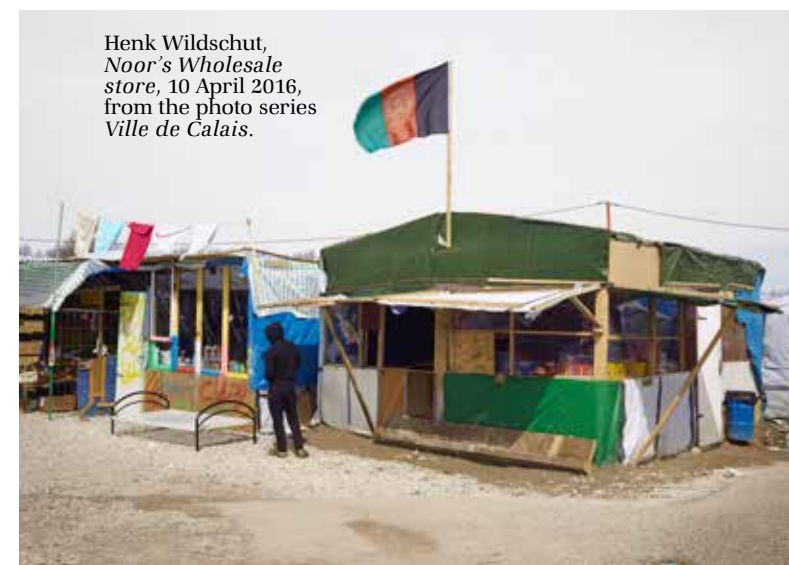
Henk Wildschut, Noor's Wholesale store , 10 April 2016, from the photo series Ville de Calais .

En dan tot slot ecologie, natuur en milieu als thema's in de kunst. Als geen ander zijn kunstenaars in staat om de huidige ontwikkelingen om te zetten in autonome kunstwerken die de