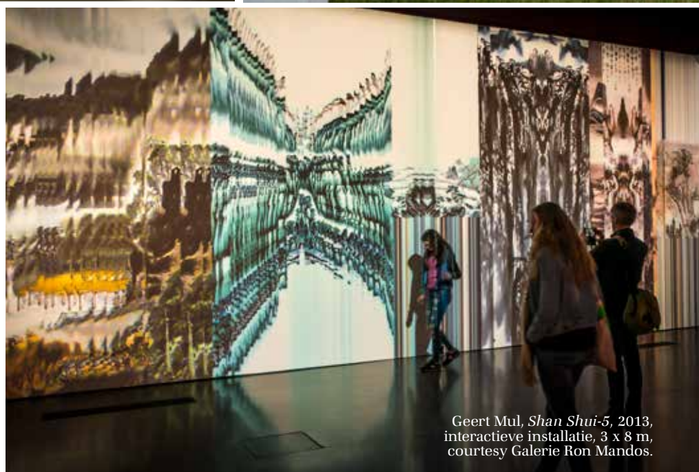
Geert Mul, Shan Shui-5 , 2013, interactieve installatie, 3 x 8 m, courtesy Galerie Ron Mandos.

Werkte multimediakunstenaar Geert Mul in de jaren tachtig met een simpele Commodore, die een extern geheugen had van nog geen 250 kB, de opname-techniek is nu zo ver gevorderd dat zijn computers rekenen in terabytes