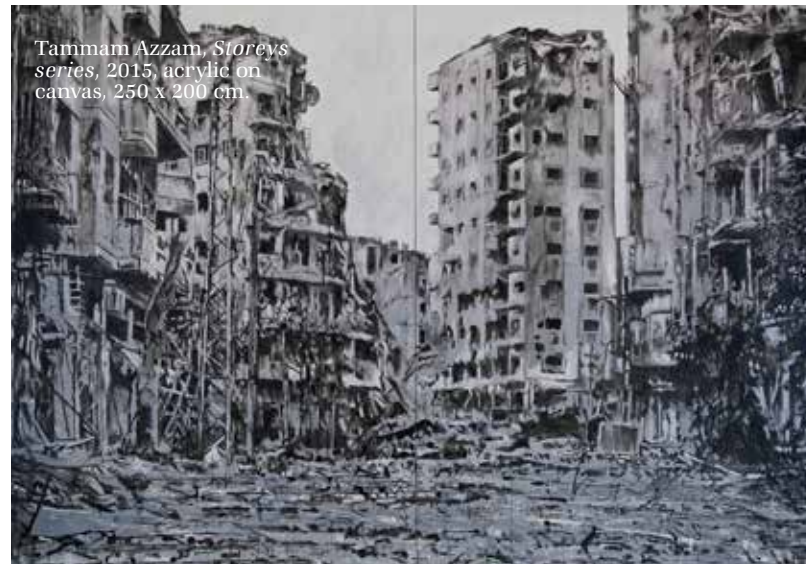
Tammam Azzam, Storeys series , 2015, acrylie on canvas, 250 x 200 cm.

De inperking van de vrijheid van meningsuiting werd fraai verbeeld met de installatie The Parthenon of Books van Marta Minujín op de Friedrichsplatz in Kassel. Het indrukwekkende geraamte van staal in de vorm van het Parthenon in Athene stond op het plein waar in 1933 zo'n tweeduizend boeken door de nazi's werden verbrand