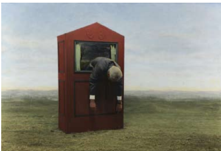
Teun Hocks 235. Untitled , 2010 Huile sur gélatine argentique sépia, 120 x 170 cm