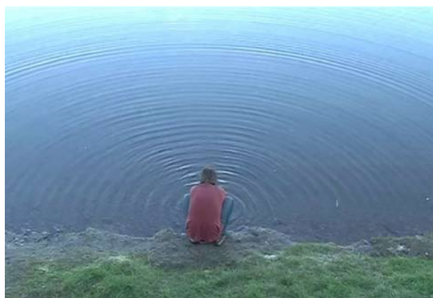
Paulien Oltheten Watercircles , 2019 Vidéo, 2 min 20