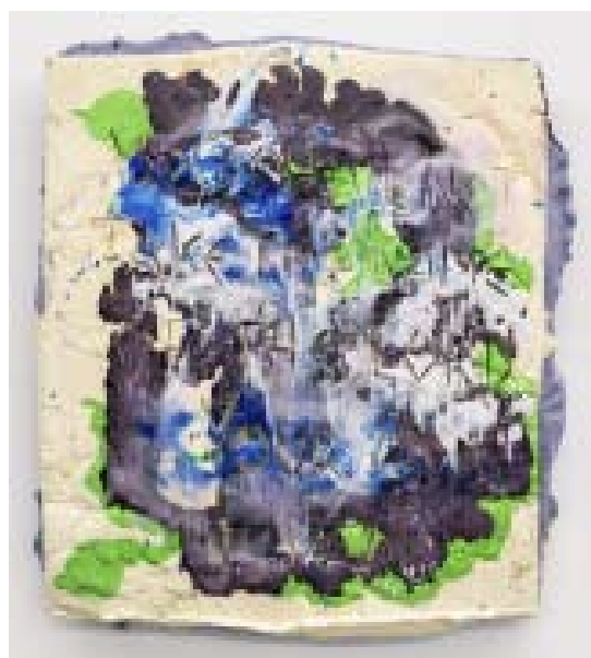
Folkert de Jong Commandment 3 , 2018 Mousse polyuréthane pigmentée, bois, métal 87 x 75 x 11 cm