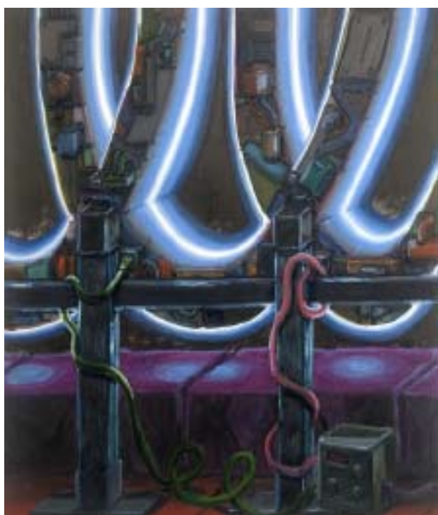
Willem Weismann sans titre , 2018 Huile sur toile, 95 x 80 cm