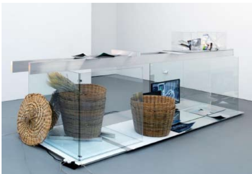
David Jablonowski Industrial3d Display , 2014 Aluminium, verre, miroirs, paniers à roseaux, seigle séché, poivrons, feuille d'impression offset, plexiglas, écrans LED Samsung, plâtre, feuilles séchées et acrylate, 140 x 400 x 103 cm